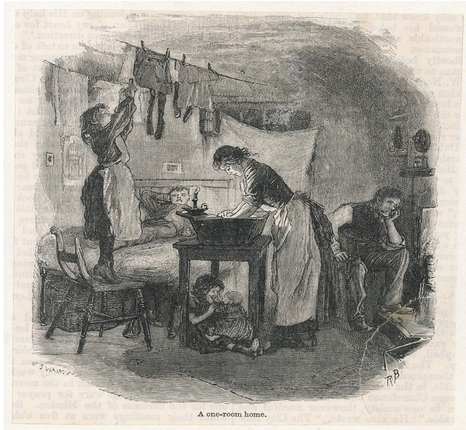
One Room Slum, 1891.