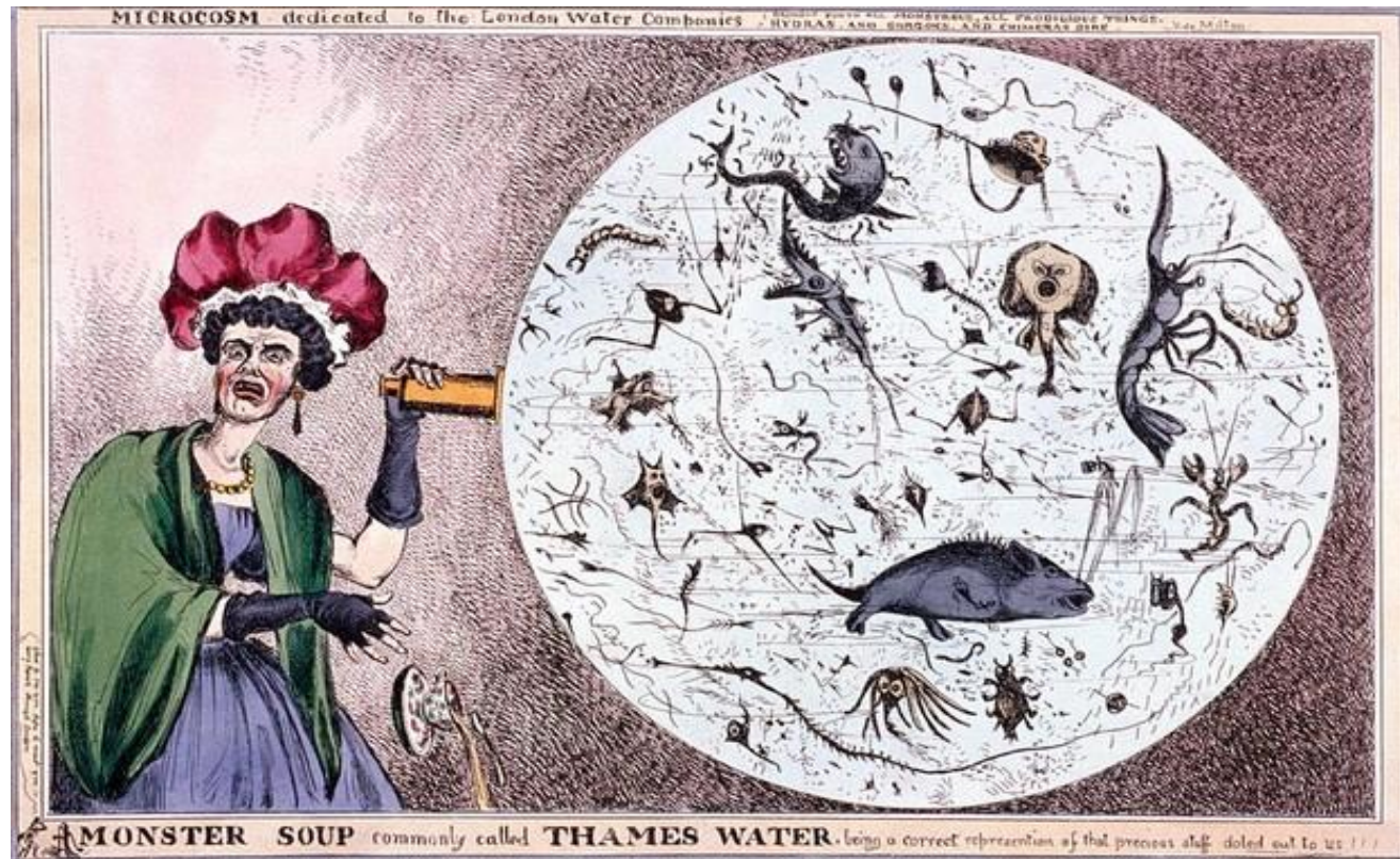
W. Heath, Monster soup commonly called Thames water , 1828.